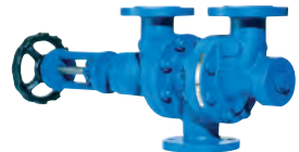
Best Availability - Change-over valve