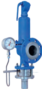
Best Availability - KUB Bursting disc