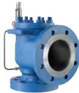
High Efficiency - Pilot operated safety valve