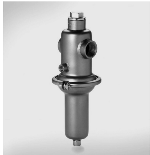
Fig. DM 652